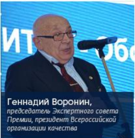
Геннадий Воронин, председатель Экспертного совета Премии, президент Всероссийской организации качества