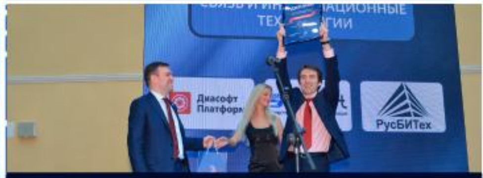
Леонид Левин Председатель Комитета Государственной думы ФС РФ по информационной политике, информационным технологиям и связи