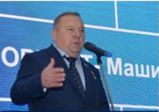
Владимир Шаманов, председатель Комитета Государственной думы по обороне, член Наблюдательного Совета Премии