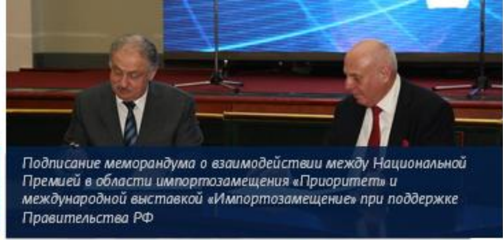
Подписание меморандума о взаимодействии между Национальной Премией в области импортозамещения «Приоритет» и международной выставкой «Импортозамещение» при поддержке Правительства РФ