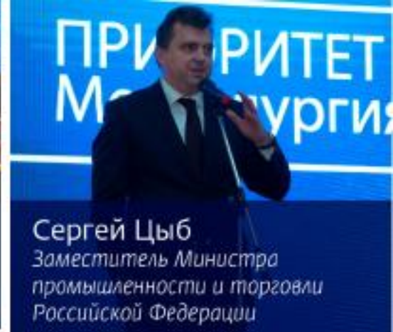
Сергей Цыб Заместитель Министра промышленности и торговли Российской Федерации